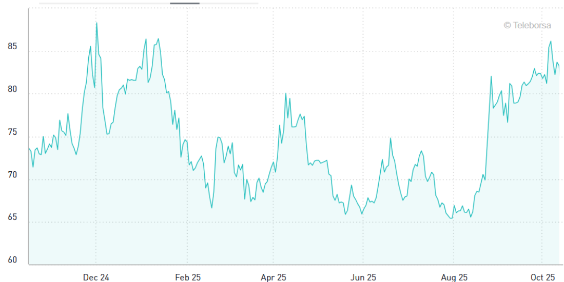
Figuur 1: Franse spread is uitgelopen

De laatste keer dat dit gebeurde was in 2018, toen de overheid 35 dagen gesloten bleef. Toen draaide het conflict om de financiering van Trumps voorgestelde muur aan de grens met Mexico. Uiteindelijk bond Trump toen in. Dit keer zien Democraten een zeldzame kans om concessies af te dwingen op het gebied van gezondheidszorg. Zij eisen verlenging van subsidies en het terugdraaien van bezuinigingen op de publieke zorgverzekering Medicaid, opgenomen in Trumps begrotingswet ('Big Beautiful Bill'). Trump dreigt op zijn beurt met massaontslagen onder federale ambtenaren om de overheid 'efficiënter' te maken. Vooralsnog lijkt een snelle oplossing niet in zicht.