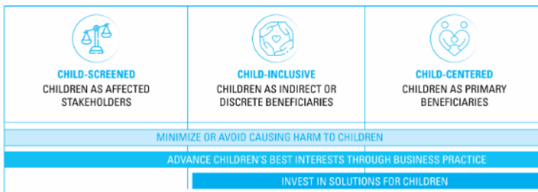
Figuur 1: Beleggingsstrategieën

Wie deze weg inslaat, stuit echter al snel op een obstakel: informatie. De meeste ESG-dataleveranciers rapporteren niet of nauwelijks over kind-specifieke risico's. Dat betekent dat beleggers zelf op zoek moeten naar relevante data, aanvullende due diligence moeten uitvoeren of moeten samenwerken met partners die beschikken over diepgaande kennis van kinderrechten en -welzijn en weten